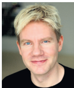
BJØRN LOMBERG POLITOLOG, LEDER AF COPENHAGEN CON- SENSUS CENTER, MIDDLESEX USA

Verden står overfor mange problemer, og at brødføde en voksende befolkning ordentligt er afgjort et af dem. Den gode nyhed er, at vi siden 1990 er godt på vej til at have halveret andelen af mennesker, der lider af kronisk sult. Den dårlige nyhed er, at det stadig efterlader over 800 millioner mennesker, som går sultne i seng hver aften. Desværre er der ingen lette måder, hvorpå man kan løse problemet hurtigt, men der er smarte måder at bruge ressourcerne, så de vil gøre stor gavn, både nu og på lang sigt. Både børn og voksne har brug for kost af høj kvalitet, men hvis man giver mindre børn ordentlig kost, gør det en stor forskel over hele deres levetid. De første 1000 dage af et barns liv er altafgørende for ordentlig udvikling. Disse børn mistrives ikke kun fysisk; de står også tilbage for de bedre ernærede i udviklingen af kognitive færdigheder. Denne mangel på udvikling har store, langsigtede konsekvenser. Børn med nedsat vækst klarer sig mindre godt i skolen og har ringere liv som voksne.