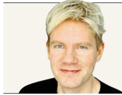
Bjorn Lomborg prezident organizace Copenhagen Consensus Center

Struktura českého státního rozpočtu se opsala z loňska. Stačilo by však přeměřovat jedno procento a může to přinést desetinásobný benefit pro společnost. Přidáte na školky, děti si povedou lépe ve škole a do budoucna to sníží kriminalitu.